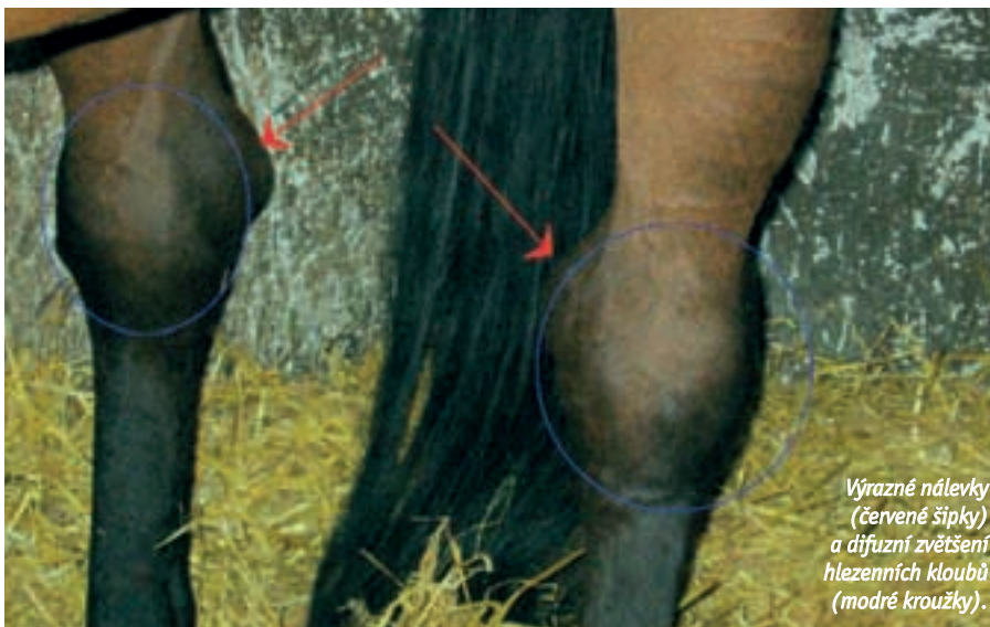
Výrazné nálevky (červené šipky) a difúzní zvětšení hlezenních kloubů (modré kroužky).

MVDr. Dominika Švehlová Foto archiv autorky